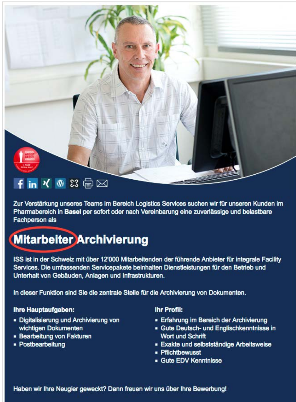
Bild: Ausschnitt aus einem Stelleninserat