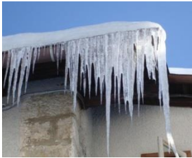
fest (Eis) 1

a) Wasser gibt es in drei Aggregatzuständen: