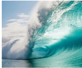
flüssig (Wasser) 2