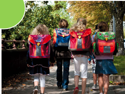
Auf dem Schulweg